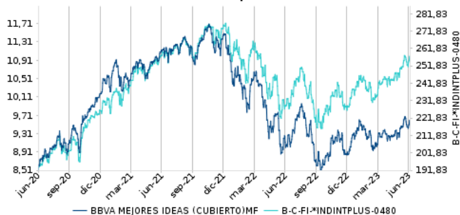
Gráfico evolución valor liquidativo últimos 5 años

Se advierte que el índice de referencia reflejado en el gráfico hasta 2014 inclusive, no recoge rentabilidad por dividendos.