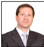
George Gosden Desde Enero 13

Sociedad gestora: Threadneedle Man. Lux. S.A. Fondo de tipo paraguas: Columbia Threadneedle (Lux) I Categoría SFDR: Artículo 6 Fecha de lanzamiento: 06/04/99 Índice: MSCI AC Asia Pacific ex Japan Index