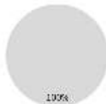
2. Alineación de las inversiones con la taxonomía, excluida la deuda pública*