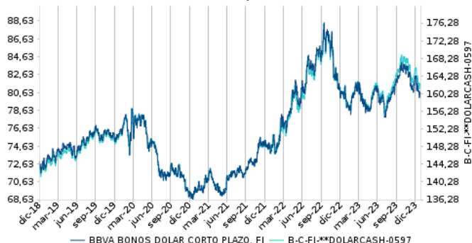
Gráfico evolución valor liquidativo últimos 5 años