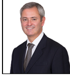
Jeremy A. Smith Desde Nov 22

Sociedad gestora: Threadneedle Man. Lux. S.A. Fondo de tipo paraguas: Columbia Threadneedle (Lux) I Categoría SFDR: Artículo 6 Fecha de lanzamiento: 05/10/16 Índice: - Grupo de comparación: - Divisa del fondo: GBP Domicilio del Fondo: Luxemburgo Patrimonio total: €317,6m N.º de títulos: 42 Precio: 14,6225 Toda la información está expresada en EUR