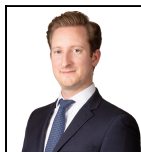
Christopher Hult Desde Sept 22

Sociedad gestora: Threadneedle Man. Lux. S.A. Fondo de tipo paraguas: Columbia Threadneedle (Lux) I Categoría SFDR: Artículo 8 Fecha de lanzamiento: 21/09/18 Índice: iBoxx EUR Corporate Bond Index Grupo de comparación: Morningstar Category EUR Corporate Bond Divisa del fondo: EUR Domicilio del Fondo: Luxemburgo Patrimonio total: €311,8m N.º de títulos: 278 Precio: 10,3207 Toda la información está expresada en EUR