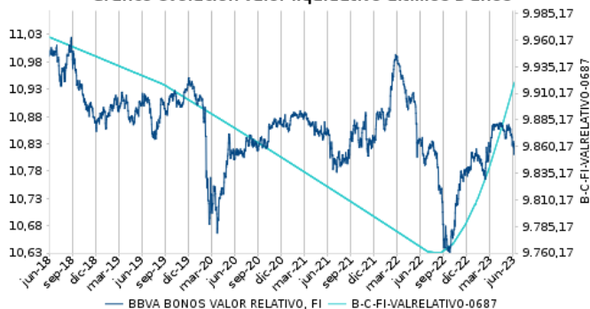
Gráfico evolución valor liquidativo últimos 5 años