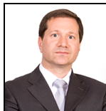
George Gosden Desde Enero 13

Sociedad gestora: Threadneedle Man. Lux. S.A. Fondo de tipo paraguas: Columbia Threadneedle (Lux) I Categoría SFDR: Artículo 6 Fecha de lanzamiento: 06/04/99 Índice: MSCI AC Asia Pacific ex Japan Index