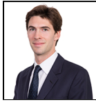
Benjamin Moore Desde Abr 19

Sociedad gestora: Threadneedle Man. Lux. S.A. Fecha de lanzamiento: 18/01/12 Índice: FTSE World Europe ex UK Grupo de comparación: Morningstar Category Europe ex-UK Equity Divisa del fondo: EUR Domicilio del Fondo: Luxemburgo Patrimonio total: €1.950,4m N.º de títulos: 39 Precio: 35,0415 Toda la información está expresada en EUR