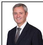
Jeremy A. Smith Desde Nov 22

Sociedad gestora: Threadneedle Man. Lux. S.A. Fondo de tipo paraguas: Columbia Threadneedle (Lux) I Categoría SFDR: Artículo 6 Fecha de lanzamiento: 05/10/16 Índice: - Grupo de comparación: - Divisa del fondo: GBP Domicilio del Fondo: Luxemburgo Patrimonio total: €318,6m N.º de títulos: 41 Precio: 14,8110 Toda la información está expresada en EUR