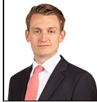
Scott Woods Desde Abr 19

Sociedad gestora: Threadneedle Man. Lux. S.A. Fondo de tipo paraguas: Columbia Threadneedle (Lux) I Categoría SFDR: Artículo 8 Fecha de lanzamiento: 03/03/11 Índice: MSCI World Small Cap Grupo de comparación: Morningstar Category Global Small/Mid-Cap Equity