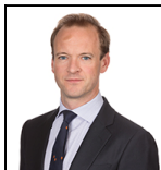
Adrian Hilton Desde Oct 20

Sociedad gestora: Threadneedle Man. Lux. S.A. Fondo de tipo paraguas: Columbia Threadneedle (Lux) I Fecha de lanzamiento: 30/09/94 Índice: J.P. Morgan EMBI Global Index Grupo de comparación: Morningstar Category Global Emerging Markets Bond