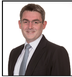
Alasdair Ross Desde Jun 14

Sociedad gestora: Threadneedle Man. Lux. S.A. Fondo de tipo paraguas: Columbia Threadneedle (Lux) I Categoría SFDR: Artículo 8 Fecha de lanzamiento: 17/06/14 Índice: Bloomberg Global Aggregate - Corporates (USD Hedged) Grupo de comparación: Morningstar Category Global Corporate Bond - USD Hedged Divisa del fondo: USD Domicilio del Fondo: Luxemburgo Patrimonio total: $1.045,9m N.º de títulos: 374 Precio: 12,9135