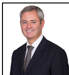
Jeremy A. Smith Desde Nov 22

Sociedad gestora: Threadneedle Man. Lux. S.A. Fondo de tipo paraguas: Columbia Threadneedle (Lux) I Categoría SFDR: Artículo 6 Fecha de lanzamiento: 05/10/16 Índice: - Grupo de comparación: - Divisa del fondo: GBP Domicilio del Fondo: Luxemburgo Patrimonio total: €324,5m N.º de títulos: 41 Precio: 14,2777 Toda la información está expresada en EUR