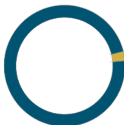
DISTRIBUCIÓN PATRIMONIO ASSET ALLOCATION ● IICs ● OTROS